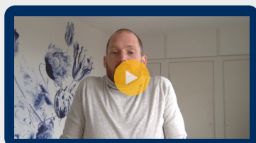
Oefening 5 Schouders